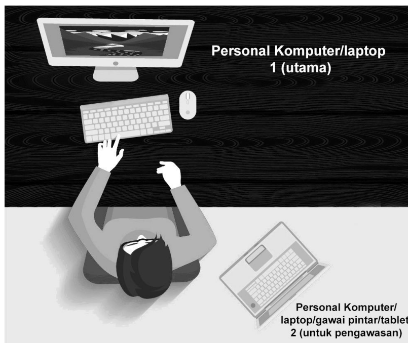
Ilustrasi 2. Tata Letak Personal Komputer/Laptop/gawai pintar/tablet Uji Kompetensi Level-1 tersebar